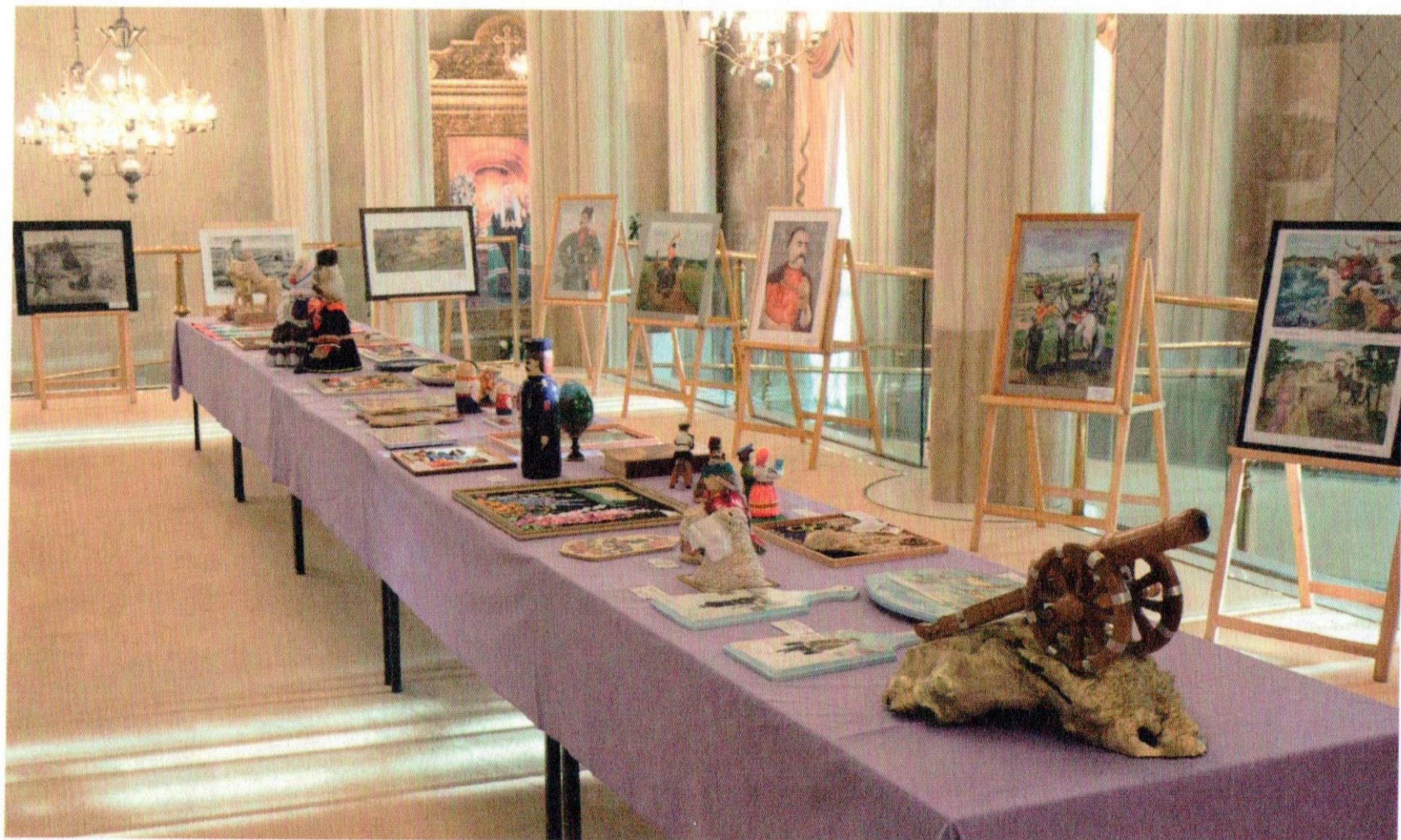
Выставка участников конкурса «Славься, казачество!» в зале Церковных Соборов Храма Христа Спасителя