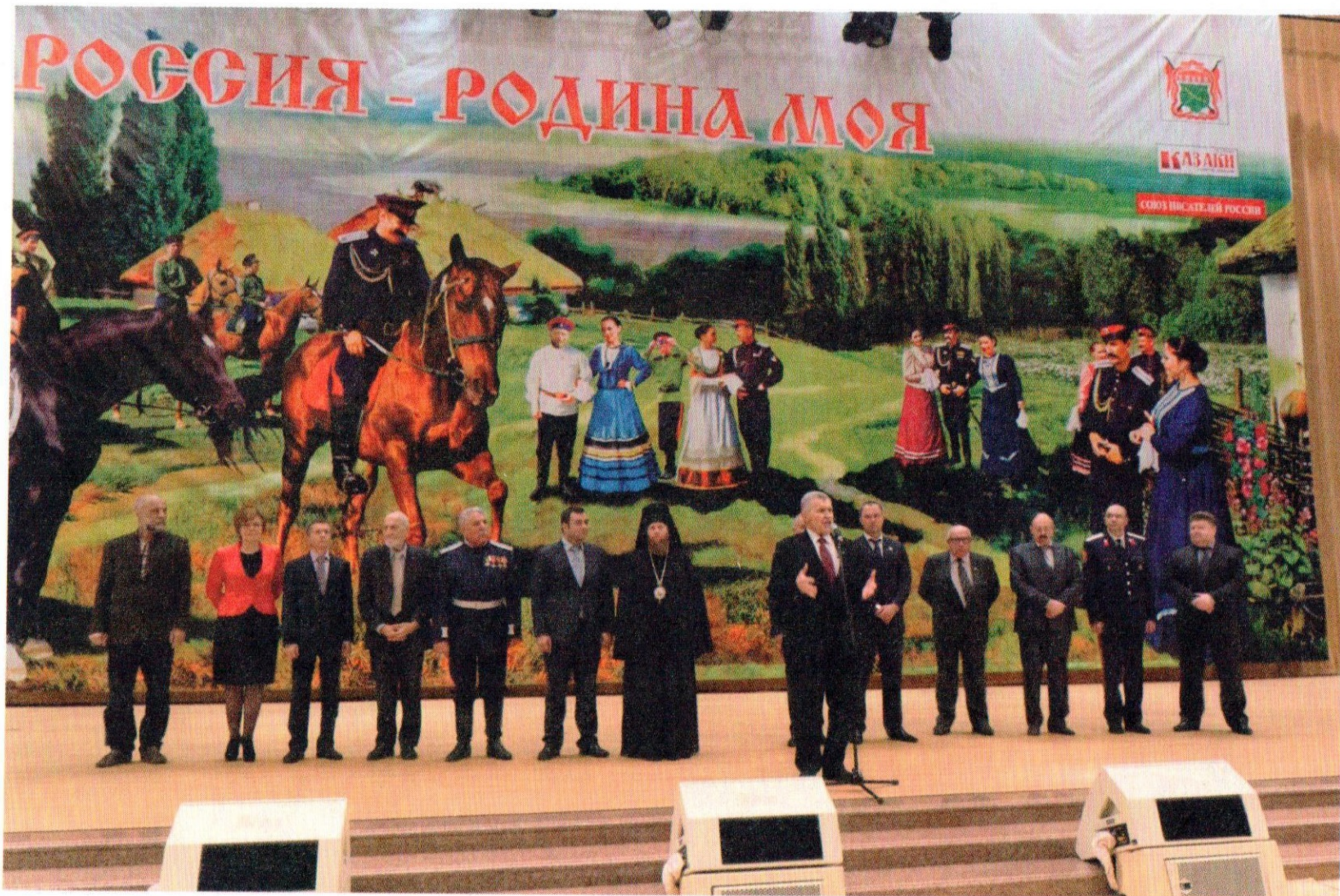
Финал конкурса «Славься, казачество!» в зале Церковных Соборов Храма Христа Спасителя