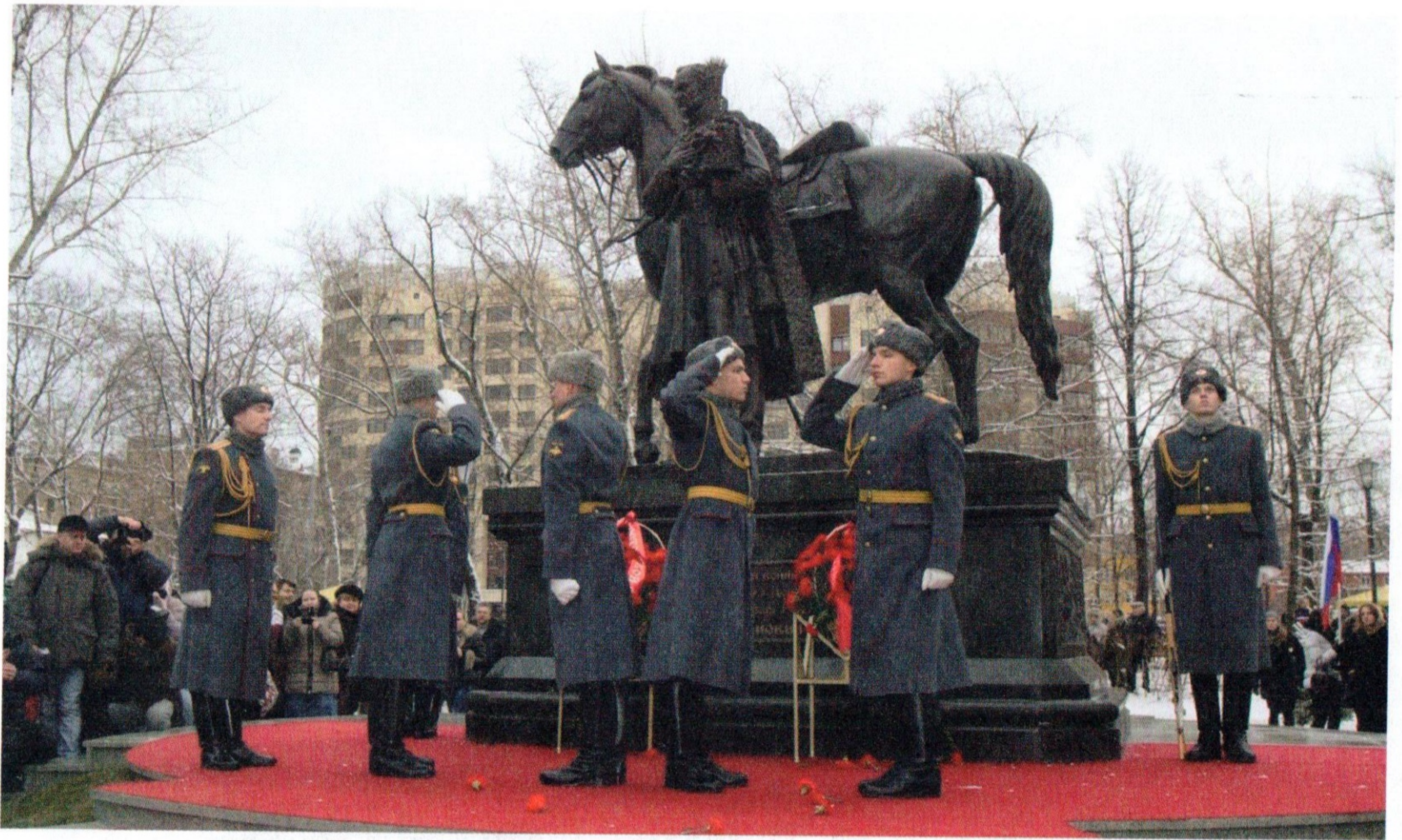
Почетный караул на памятнике атаману М. Платову, 7.12.2013 г.