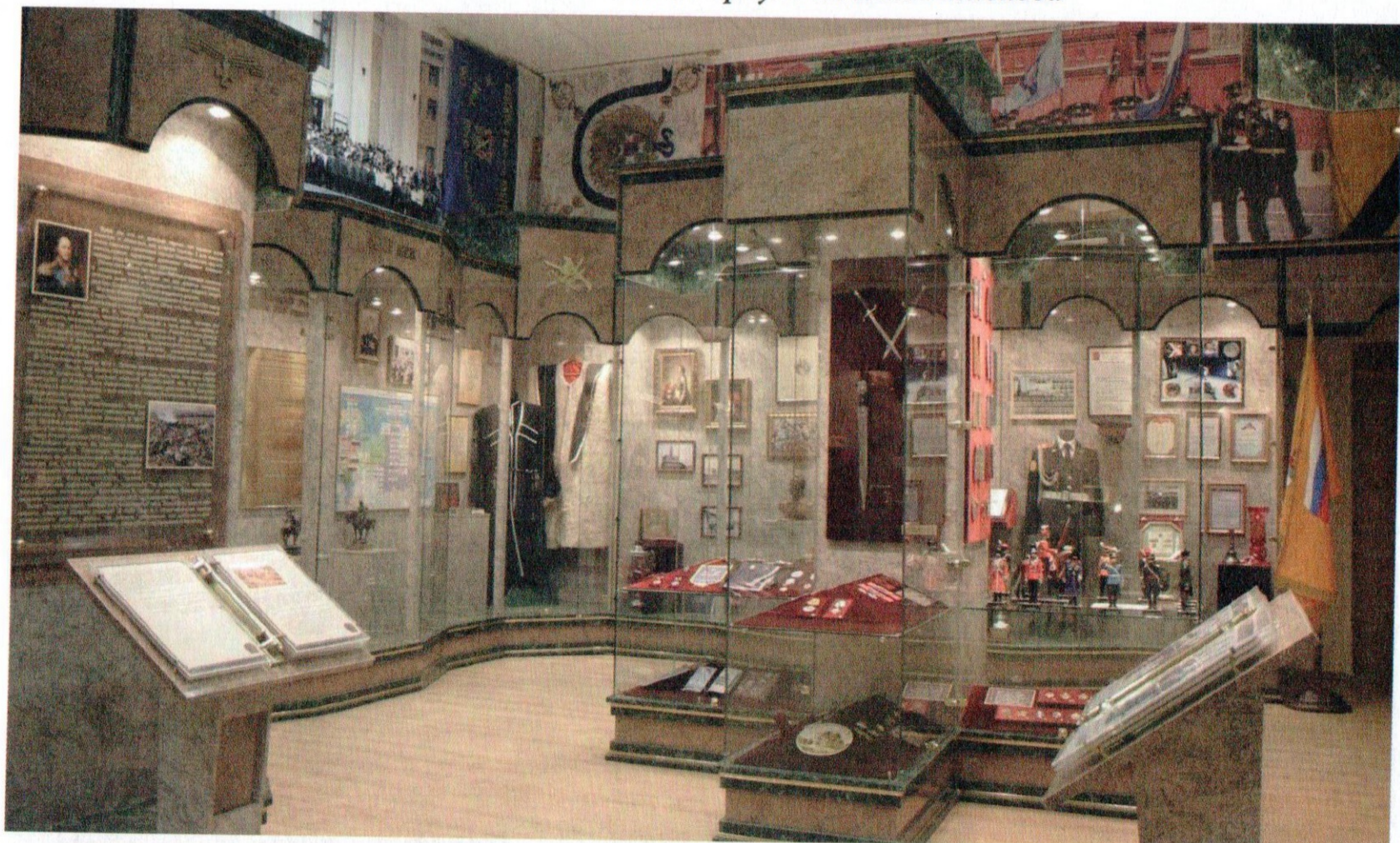
Музей «История казачества» в Московском казачьем кадетском корпусе