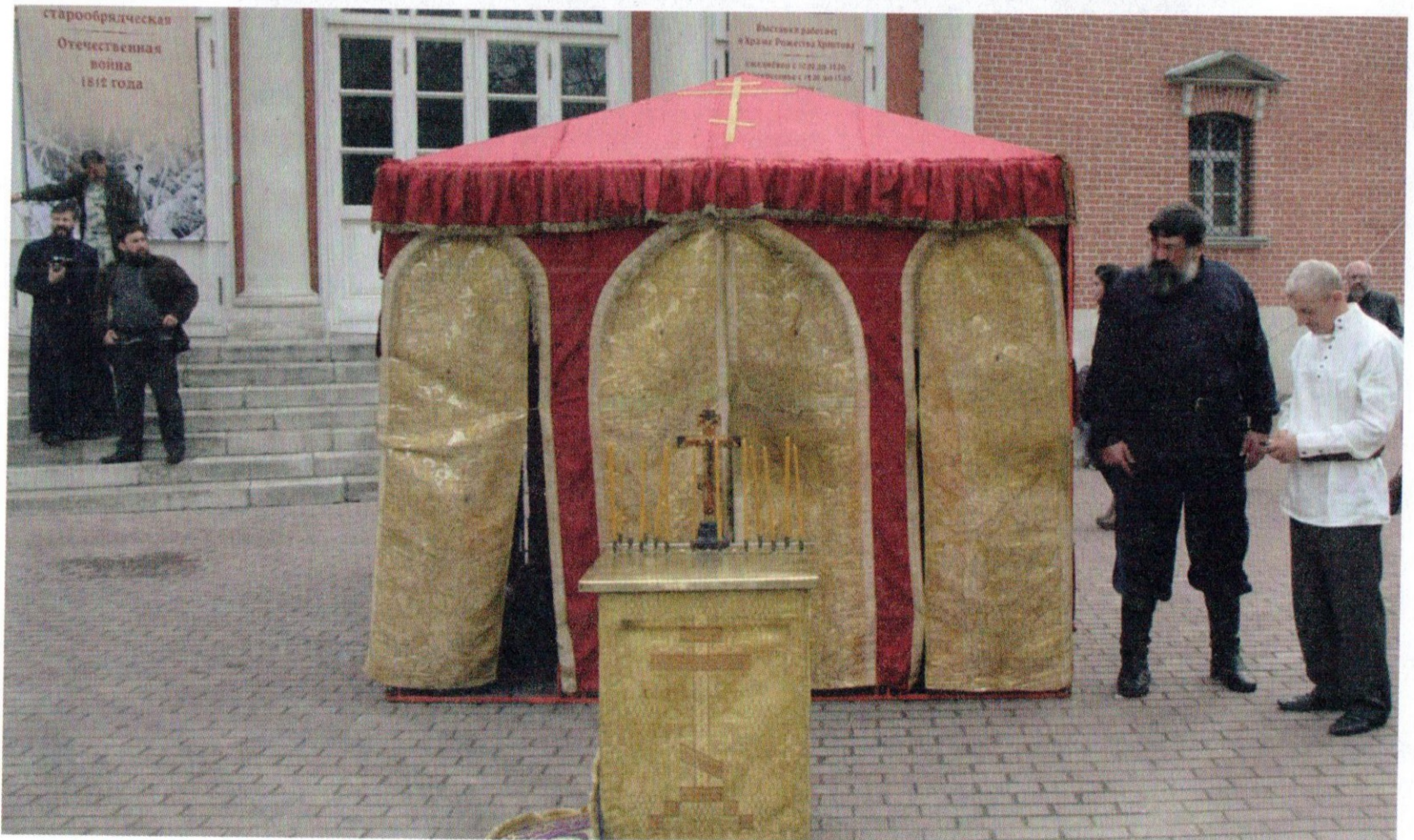
Походная церковь атамана Платова в Рогожской слободе