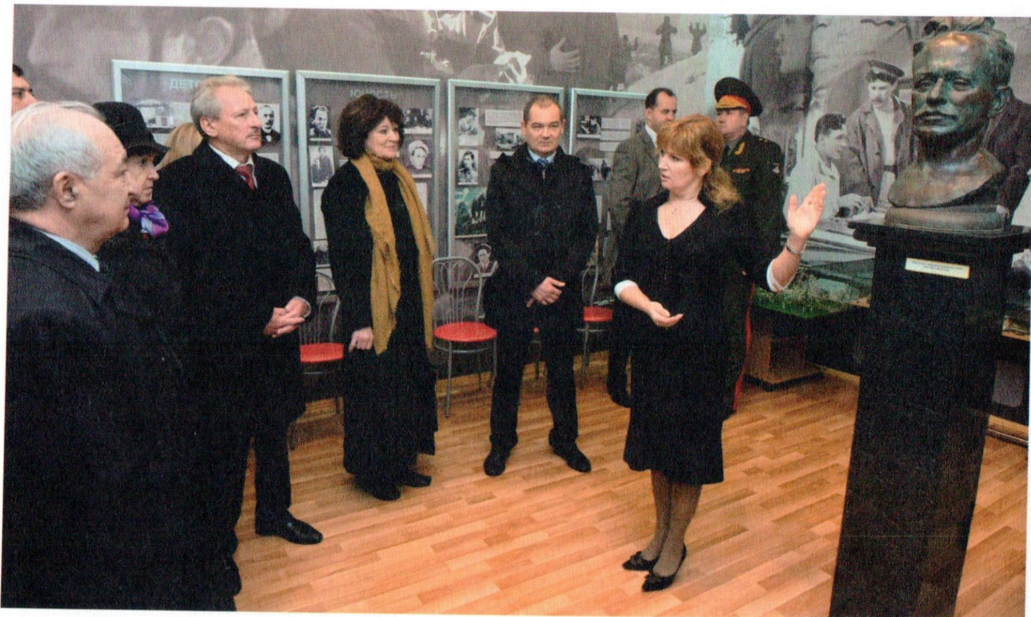
Мемориальная комната М. А. Шолохова в казачьем кадетском корпусе им.М.А.Шолохова