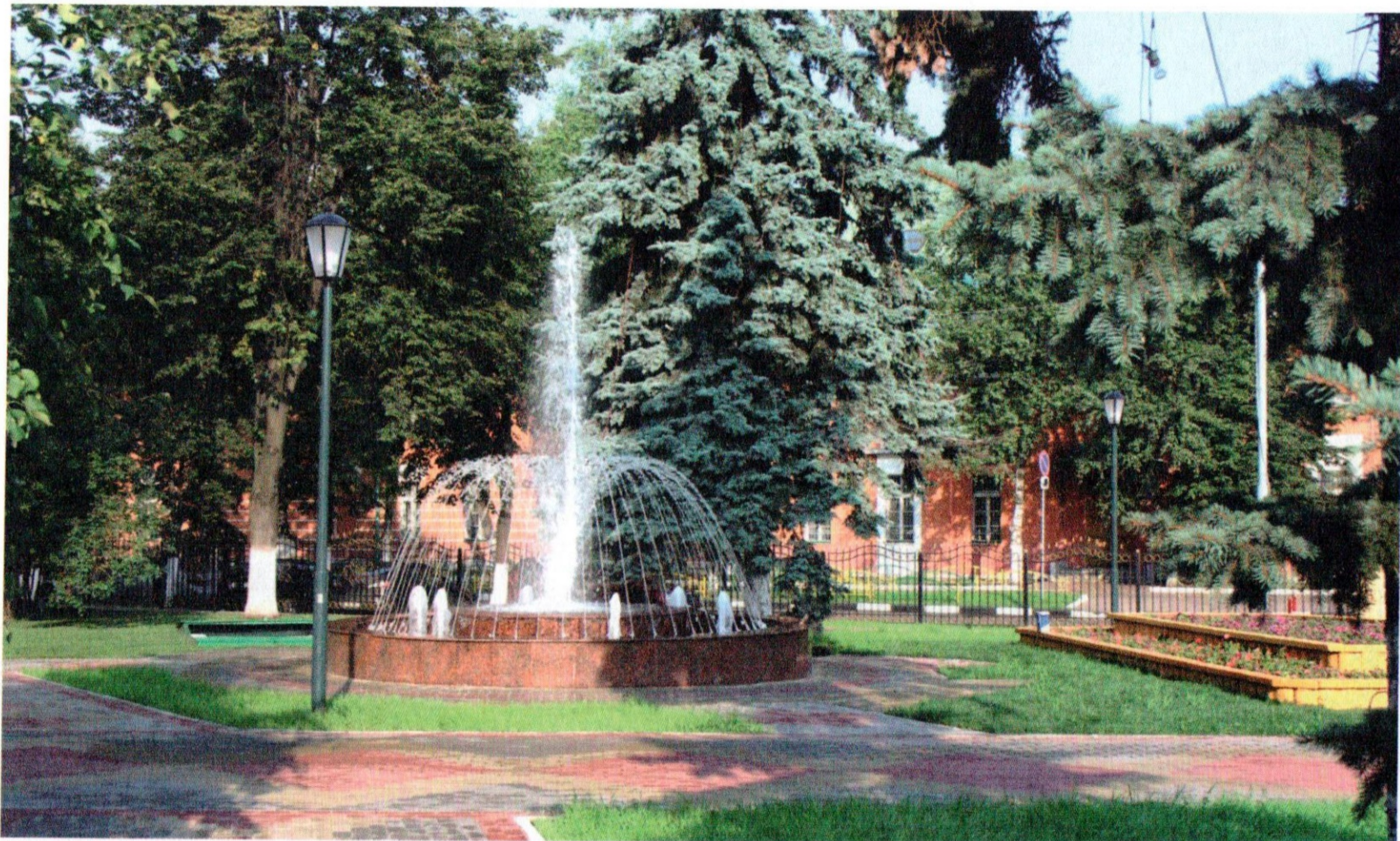
Парк Казачьей Славы в Лефортово