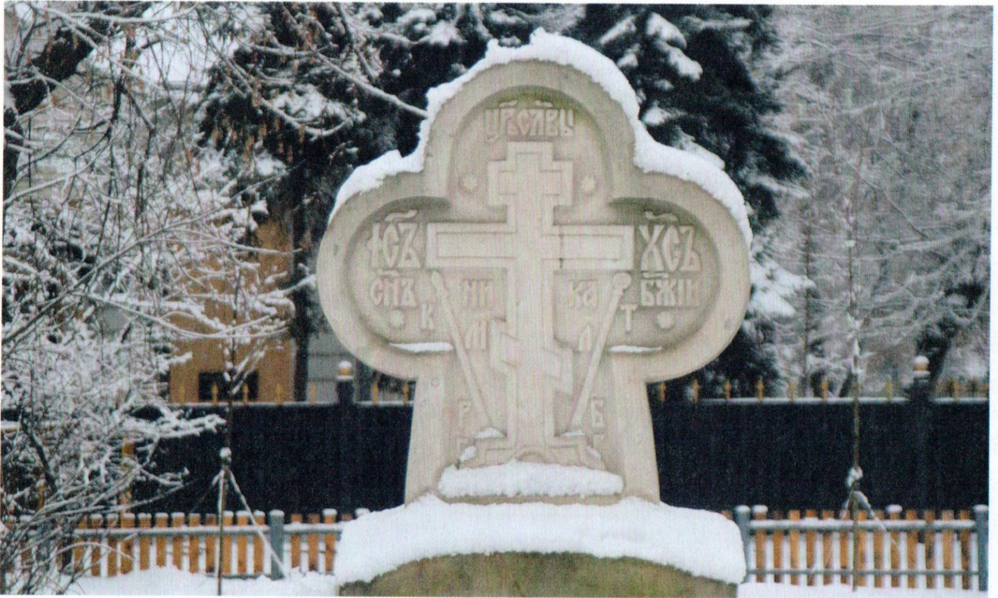
Поклонный крест в память о герое Отечественной войны 1812 г. атамане Донского казачьего войска М. И. Платове