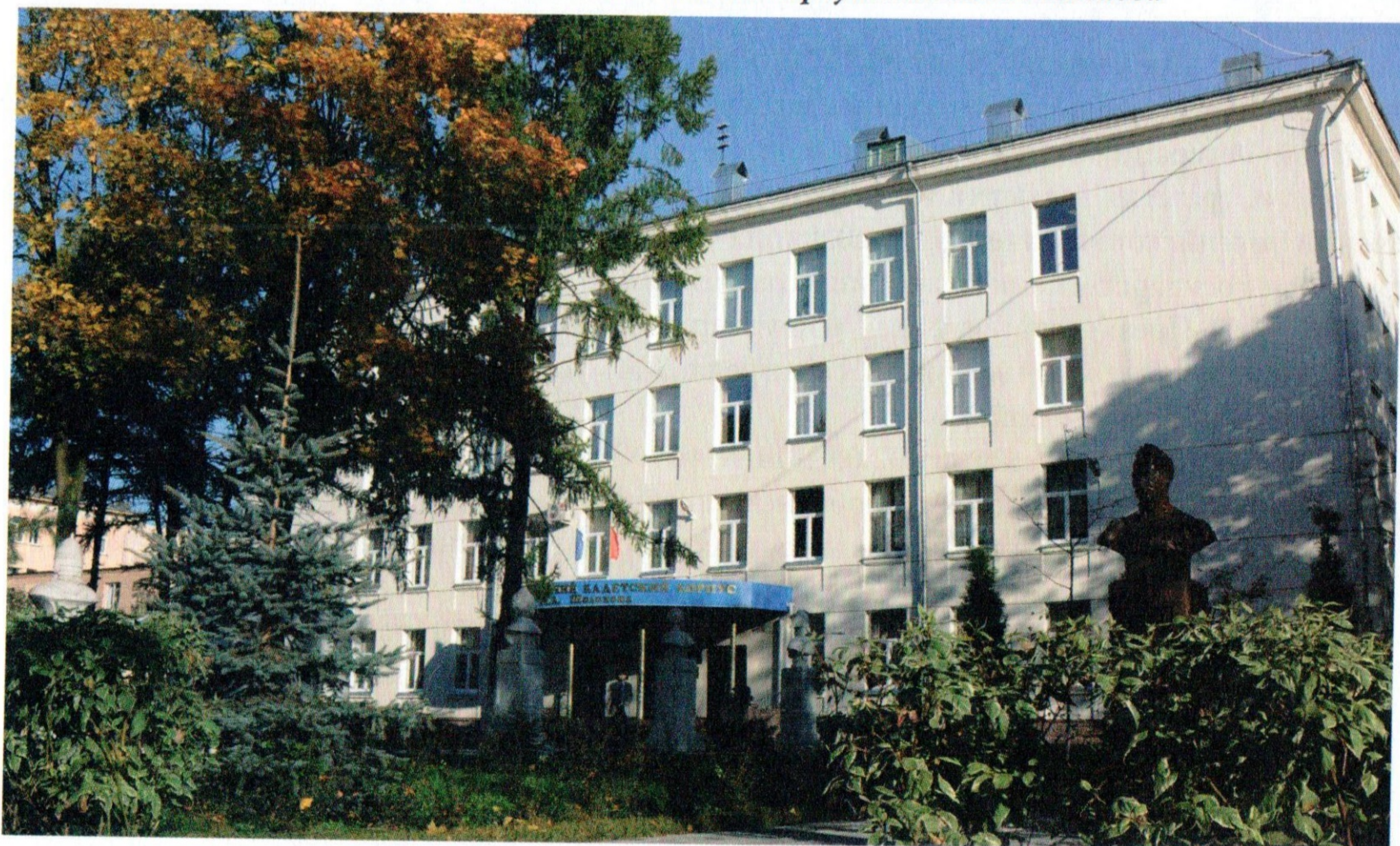
Памятник М. А. Шолохову на территории кадетского корпуса