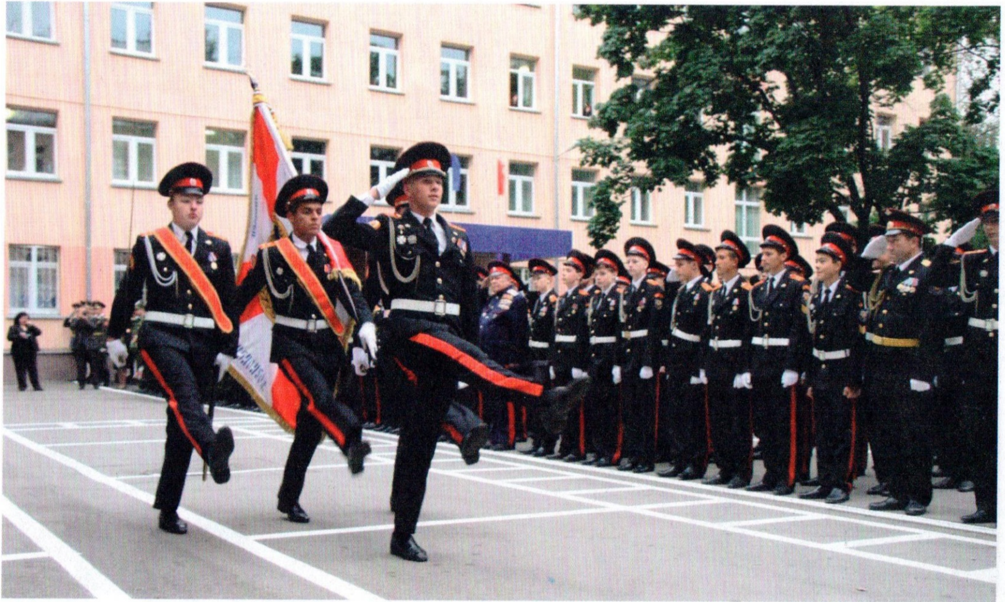
Московский казачий кадетский корпус им.М.А. Шолохова