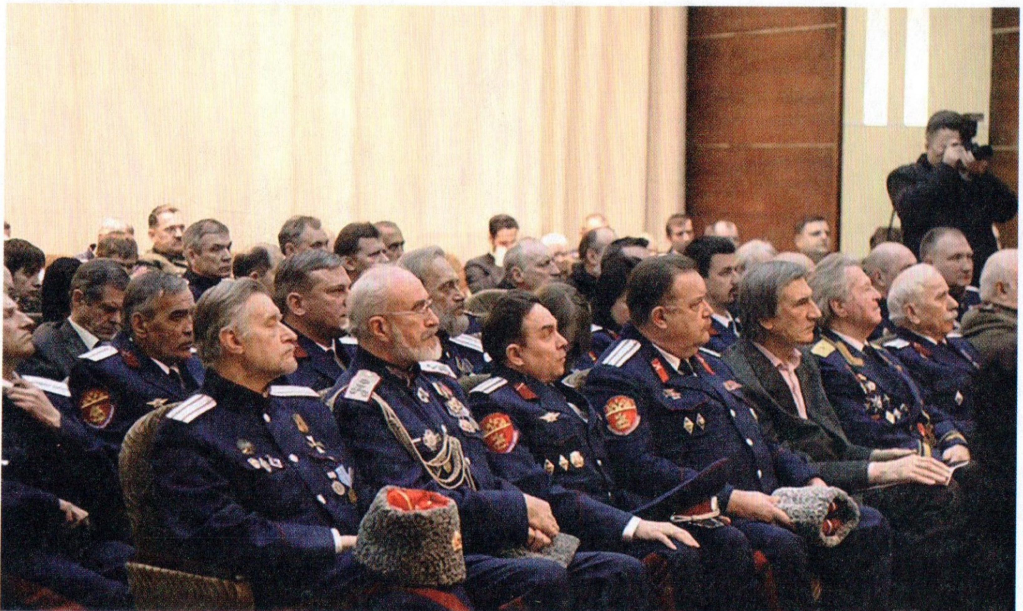
Заседание Совета по делам казачества в ЮВАО