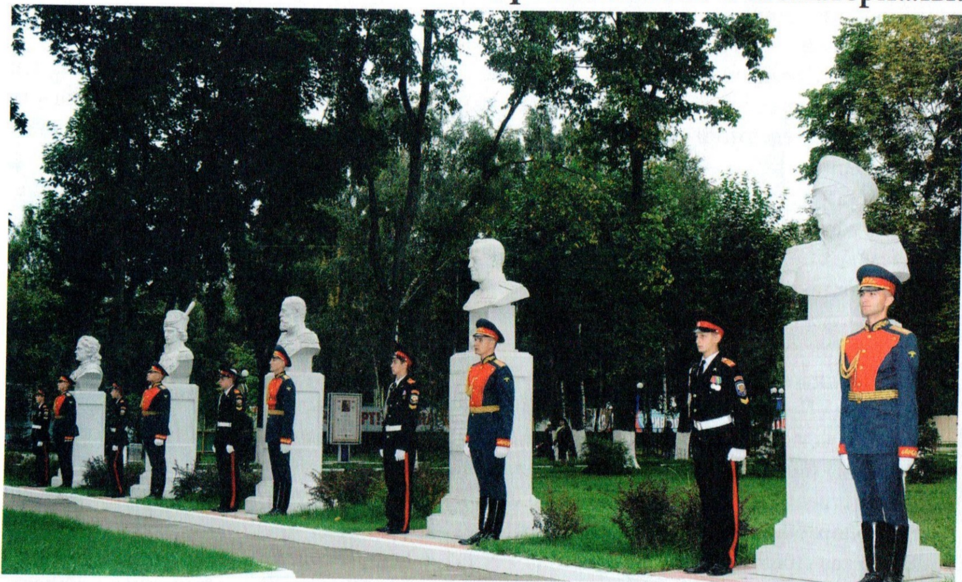
Аллея Славы на территории Московского казачьего кадетского корпуса им. М. А. Шолохова