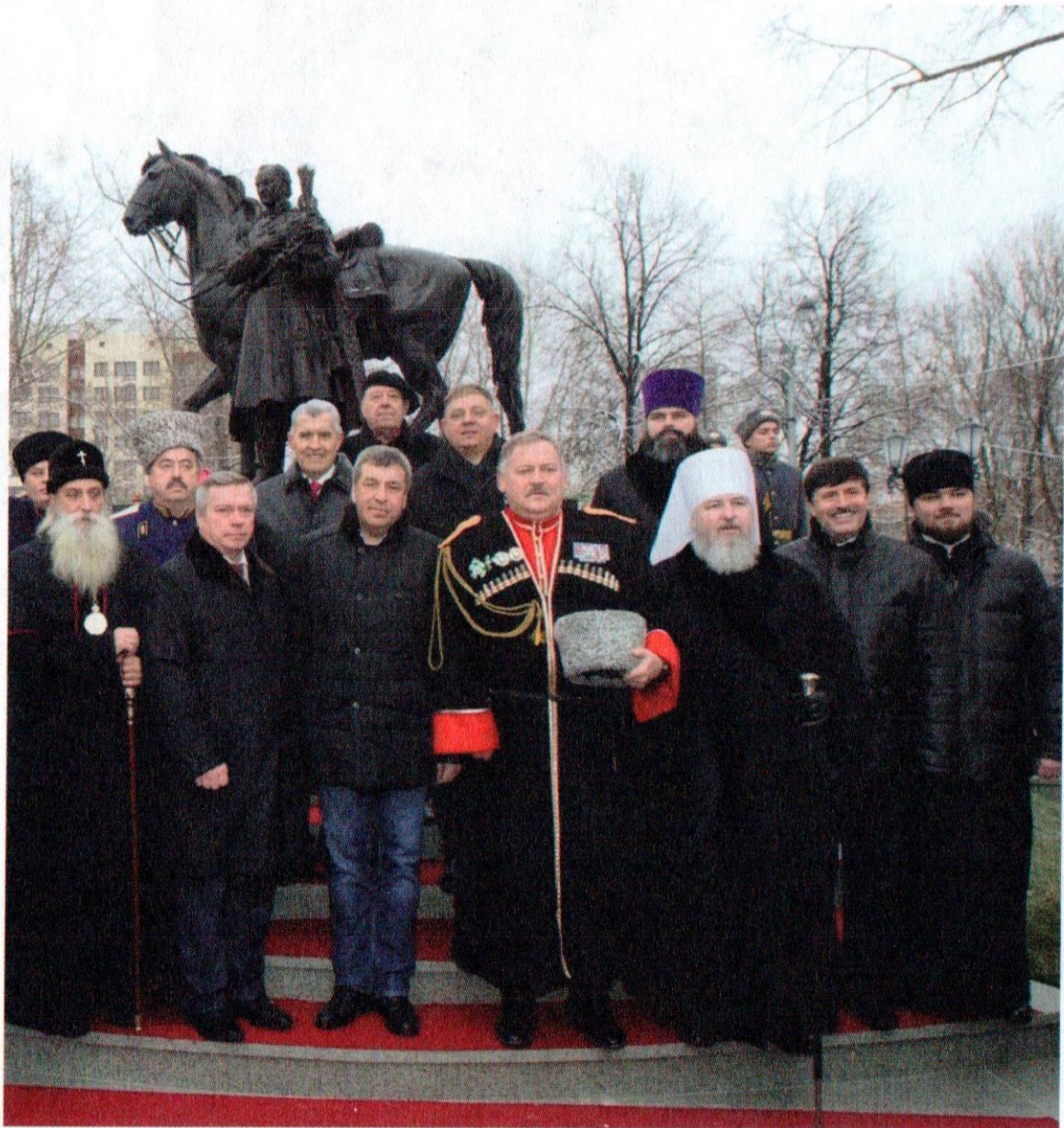
Открытие памятника атаману Матвею Платову в парке «Казачья Слава»