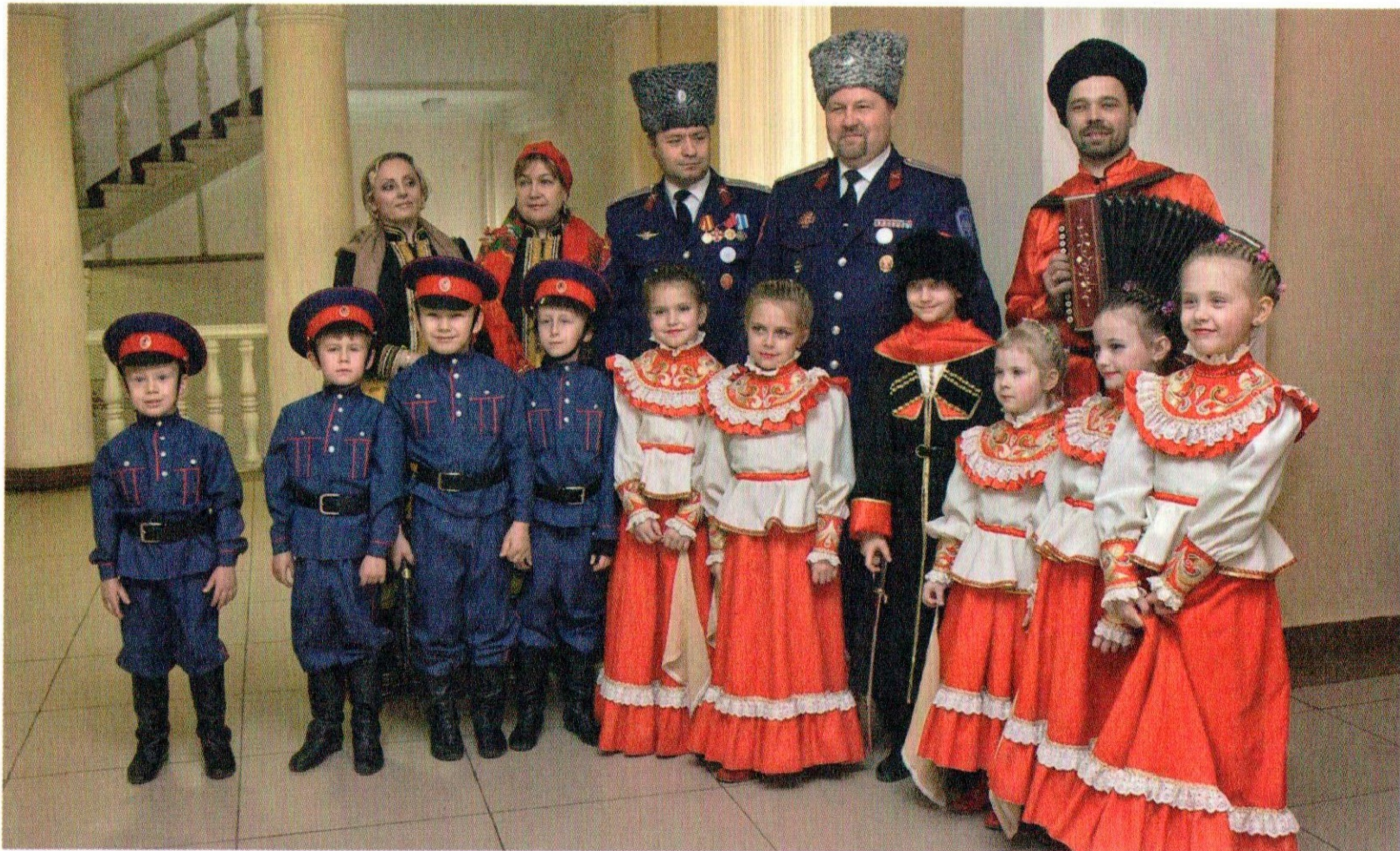
Участники и организаторы фестиваля «Лейся, казачья песня!»